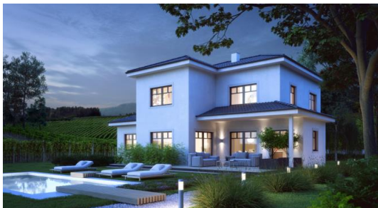
ZENKER Kundenentwurf St2016

ZENKER ist eine Marke der ELK-Fertighaus GmbH. Mehr als 20.000 Menschen wohnen bereits in einem hochwertigen Haus der österreichischen Marke. Seit 2015 konzentriert sich ZENKER auf Individualplanungen. Für die Kunden bedeutet das die Verbindung von persönlicher Beratung und Einzelanfertigung mit den Vorteilen industrieller Produktion. Seit 2016 bietet ZENKER als erste europäische Fertighausmarke die Dämmung mit Hanf als Standardausstattung an.